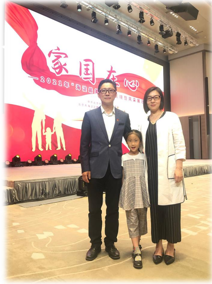
2021年带小女儿一起参加海淀最美家庭颁奖礼，大女儿因小学毕业答辩没能一起参加